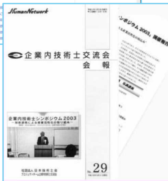
リニューアルされたホームページ画面 と 会報の表紙