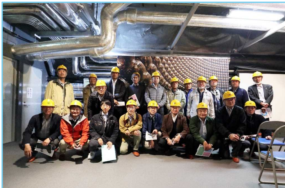
2019年 役員研修会（東京大学宇宙線研究所）

2019年 東京大学宇宙線研究所スーパーカミオカンデ（2019/11/8～11/9）