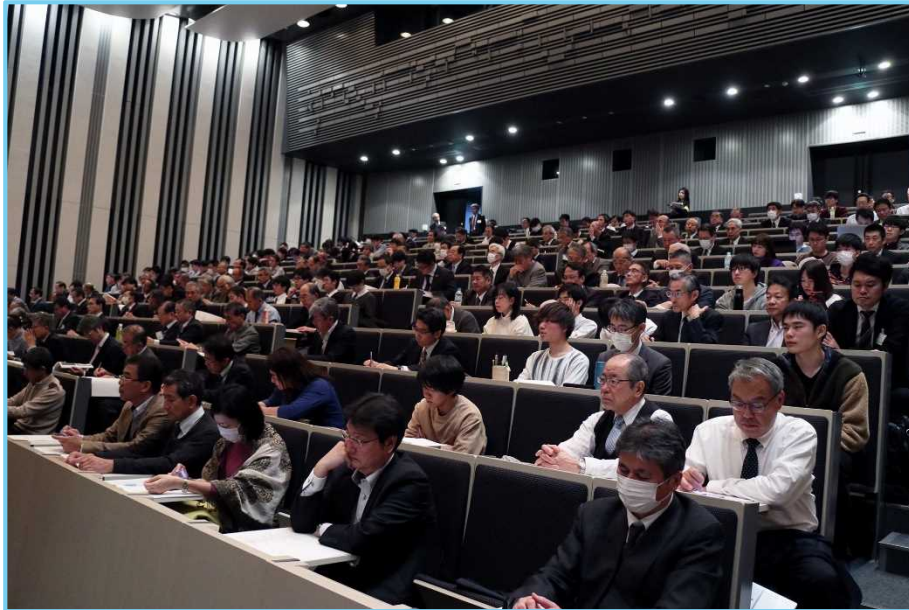
シンポジウム 2019（設立 30 周年記念シンポジウム）